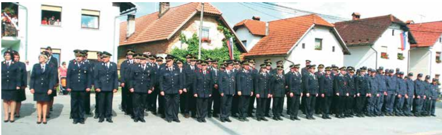
Postroj na vasi ob 100. obletnici društva

Vsaka generacija gasilcev si je prizadevala pridobiti čim boljšo opremo in svoje člane čim bolje usposobiti za gašenje požarov. Tudi danes imamo člani društva veliko volje in veselja do dela, ki ga pa nikoli ne zmanjka. Ocenjujemo, da je bil v zadnjih letih narejen velik napredek na vseh področjih. Ob stoti obletnici društva leta 2009 je bil v celoti obnovljen gasilni dom. Ob pomoči občine in vaščanov smo gasilci obnovili garažo, notranjost, fasado ter uredili lesen