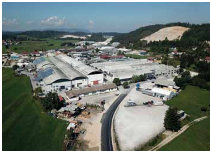
Na območju občine Cerknica je bil v letu 2018 zabeležen porast gospodarskih subjektov.

Sprememba zakona je po oceni Silve Šivec res drastično posegla v izvajanje gradbenih del. »Gradbeniki imajo občutek, da je tisto podjetje, ki deluje kot inženiring, bolj privilegirano,« opazuje sogovornica. Z novim zakonom je