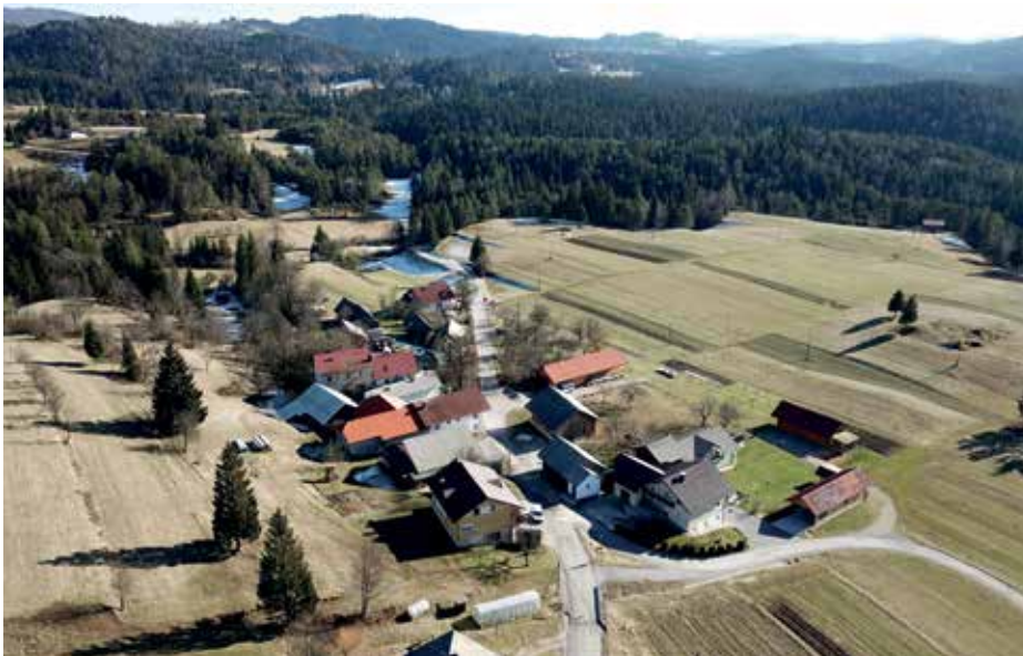
Gručasto naselje v južnem delu Vidovske planote