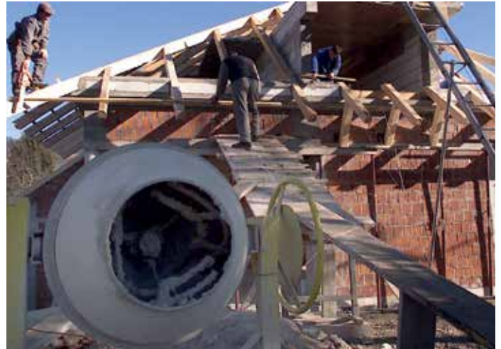
Po novi zakonodaji novogradnje v celoti lahko prevzemajo le gradbeni inženirji, ki so vpisani v imenik in imajo šesto ali sedmo stopnjo izobrazbe.