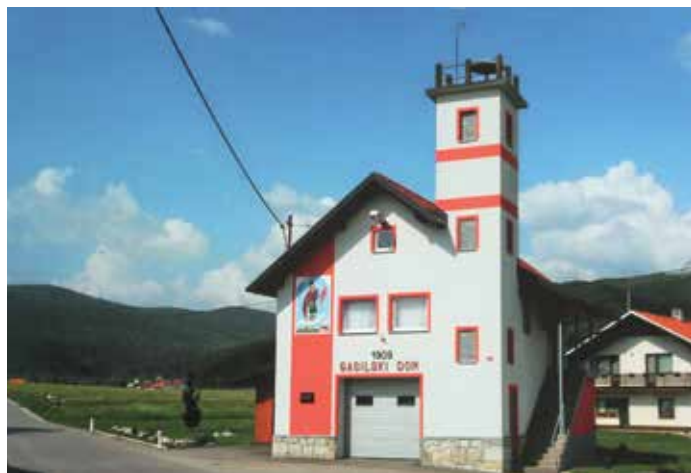
Gasilni dom je bil v zadnjih letih temeljito obnovljen.

Društvo je poleg požarne varnosti ves čas skrbelo tudi za družabne dogodke – organiziralo je vrtno veselice in prirejalo igre. Čeprav se je v času obeh vojn članstvo precej