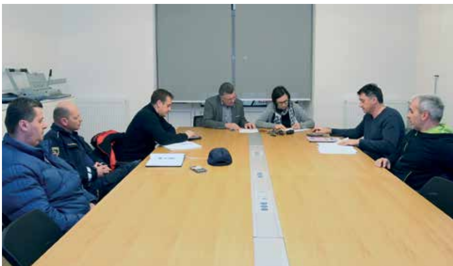
Občinski štab CZ je na sestanku konec leta ugotovil, da je dobro usklajen in se zaveda svojih nalog.

Občinski štab CZ se je sestel konec lanskega leta in ugotovil, da do izrednih razmer ni potrebe po vnovičnem snidenju, saj vsi poznajo svoje naloge. »Poveljnik v sodelovanju z županom štab skliče v izrednih razmerah,« pojasnjuje Knap. V zadnjih letih se je to zgodilo v žledolomu v začetku leta 2014 ter poplavah. Najbolj smo si zapomnili tiste konec istega leta. Žled in poplave pa niso edine nadloge, ki nas na Cerkniškem lahko doletijo v večji meri. Zgodijo se nam lahko tudi hujši vetrolomi in potresi. Ne smemo pozabiti, da Cerkniško jezero leži vzdolž Idrijske tektonske prelomnice. 1. januarja leta 1929 je Cerknico stresel potres z magnitudo 5,6, ocenjen pa je bil s sedmo do osmo stopnjo po evropski potresni lestvici. Na Cerkniškem smo na potres z epicentrom v Javornikih čisto pozabili, pa tudi v Postojni ne vlečejo zamer. Edina žrtev t. i. Cerkniškega potresa je bi namreč eden izmed stalagmitov v njihovi jami. Poveljnik črnim scenarijem dodaja še enega: