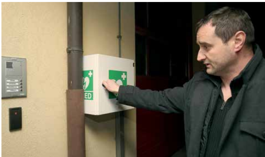
Ti i. pametna omarica za AED, ki je na steni gasilskega doma v Cerknici, je bila prva takšna v Sloveniji, zdaj jih je na testu še nekaj.